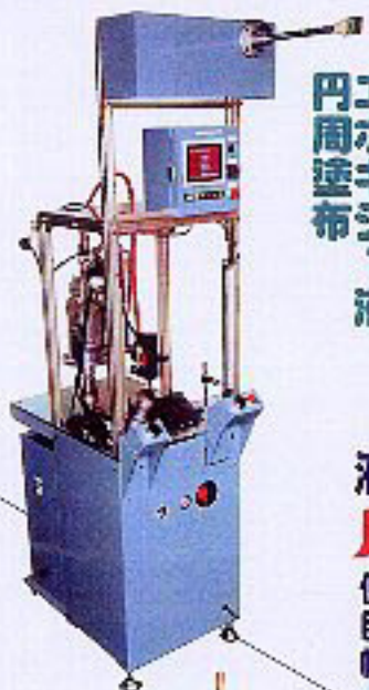
液状パッキン塗布装置