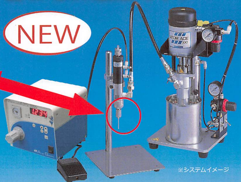
※システムイメージ