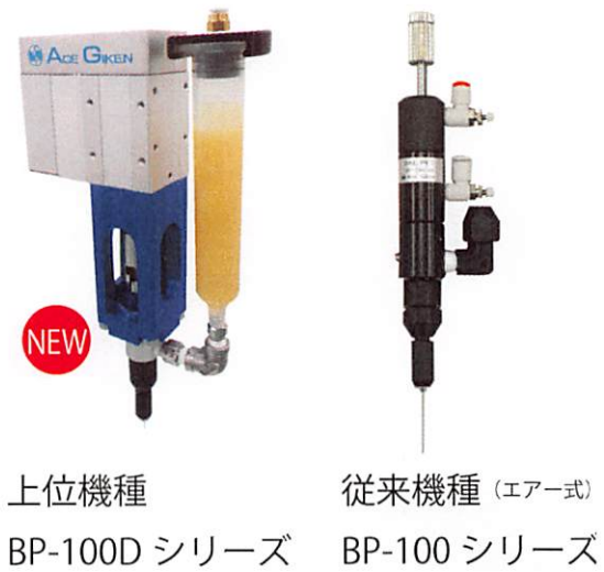
上位機種 BP-100D シリーズ 従来機種（エア式） BP-100 シリーズ