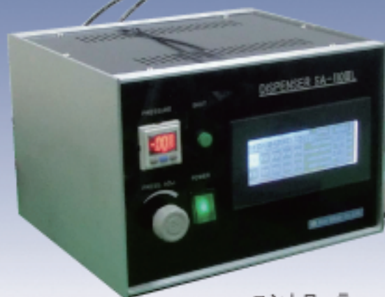
コントローラー SA-110 III L