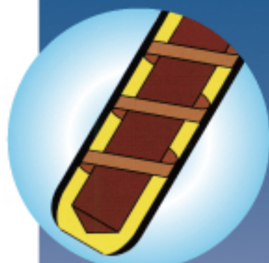
スクリーウ部イメージ図